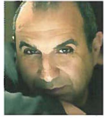
ステファノ・ジョバンノニ (Stefano Giovannoni)

1954年 ラ・スペツツィア生まれ 1978年 フィレンツェ大学建築学部卒業後、ミラノで建築・デザイン活動を始める。 1979年 フィレンツェ大学建築科、ミラノ・ドムスアカデミー、等で教鞭をとる。