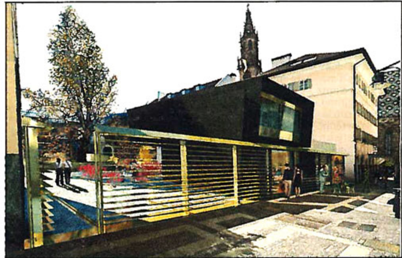
Il progetto visto da vicolo Parrocchia

nascimentali, per farsi solo intravedere dalla piazza Walther.