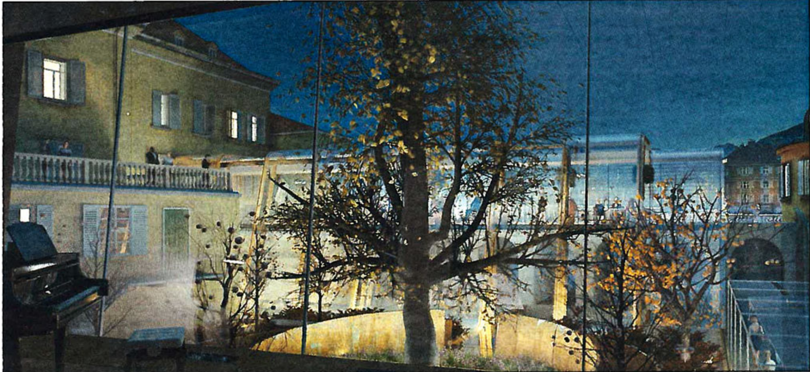
La terrazza di Palazzo Campofranco ed il giardino interno rinascono. Si parte subito. Ecco il progetto dell'architetto romano Massimo D'Alessandro nel rendering

In superficie invece, il contemporaneo salirà fin sul terrazzo che vedrà aggiungersi un "corpo" che conterrà bar e ristorante e che si aprirà poi sulla parte pubblica, la terrazza con le sue ringhiere neori-