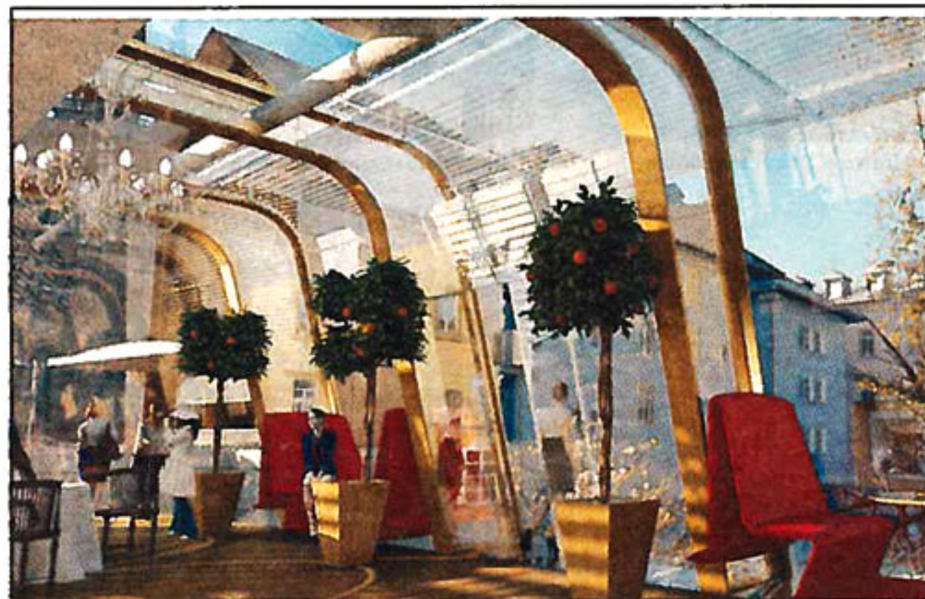
Ecco come sarà la terrazza di Palazzo Campofranco